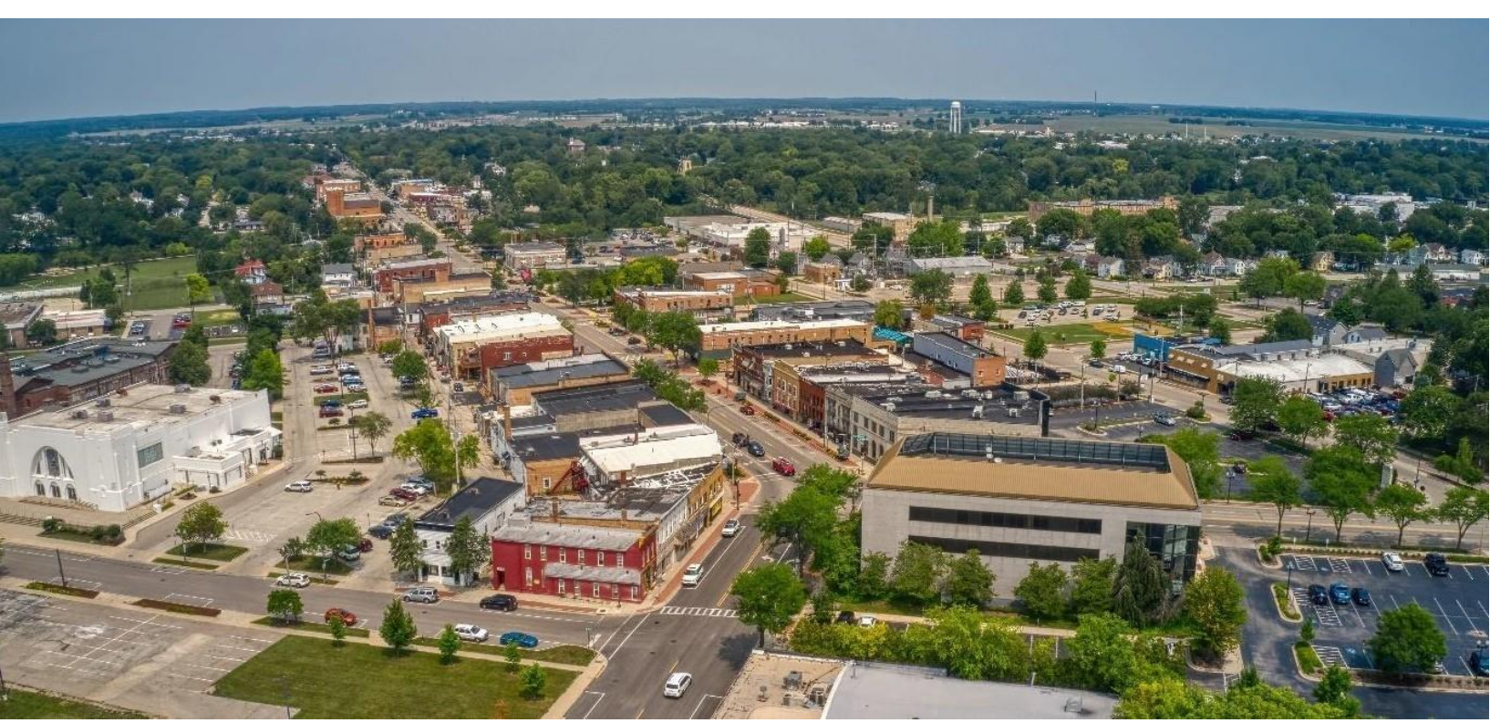
Suburb ng Belvidere, Illinois

Ang pagsisikap na ito ang bumubuo sa aming bisyon sa hinaharap. Sa susunod na 10 na taon, nilalayan naming sukatin at subaybayan ang ating pag-unlad patungo sa pagtupad sa mga pahayag ng bisyon na ito: (Section 2, Introduction and Vision for Digital Equity):